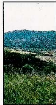
Le colline piacentine

Il Regno d'Italia non raggiungeva i 33 milioni di abitanti, e vantava 5 milioni di bovini, quasi 9 tra ovini e caprini, un milione di asini e 327.276 muli, mentre i cavalli erano 741.739 (esclusi, precisa l'Atlante, quelli della Real Casa, sul cui numero lascia insoddisfatta la nostra curiosità). Le province erano 69 (rispetto alle attuali 103); la città più popolosa era Napoli, con oltre 546.000 abitanti, seguita da Milano (490.000), mentre Roma non raggiungeva i 425; Bologna si collocava al 9° posto, sfiorando i 148.000.