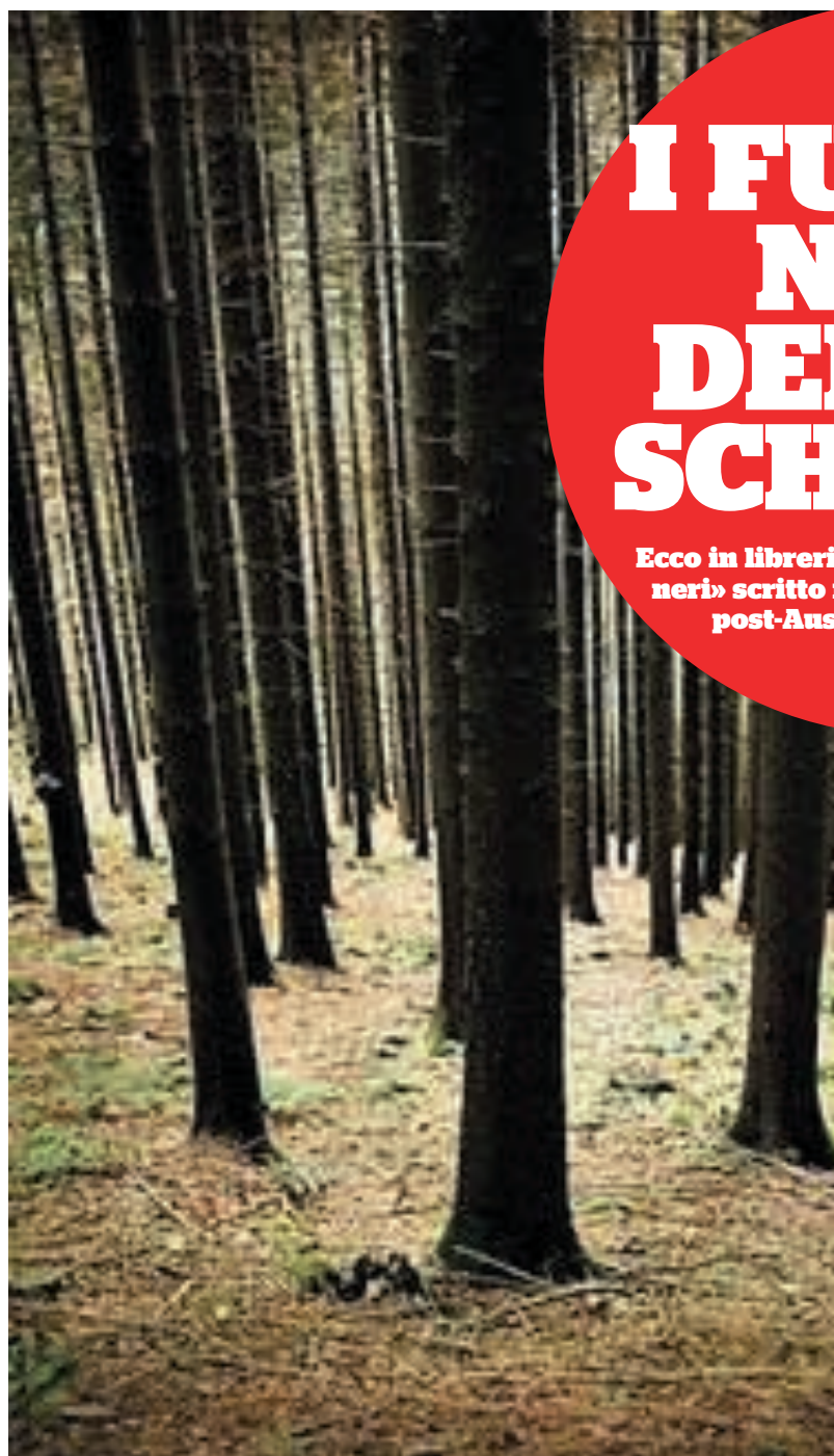
La foresta nera

All'inizio sembra un sogno, uno di quei sipari che Schmidt alza nel corso della narrazione: un uomo solitario che vaga per boschi e strade di campagna deserti, solo scheletri umani a segnare il cammino. Dopo un certo numero di pagine, in cui sei «preso» nella fantasmagorica lingua di Schmidt, catturato nei suoi interstizi, nei suoi ritmi, ti accorgi che è invece tutto fantasticamente vero: una guerra, una bomba all'idrogeno, e l'ultimo uomo sulla terra, a osservare il disastro, a scrivere la fine. Un signor Nessuno, l'«Utys» omerico, vaga in una terra metamorfica, dove le vestigia scheletriche degli umani si confondono e trapassano in natura – senz'altro – dopo che «l'esperimento uomo, il fetente, è terminato». Poi arriva una donna: ma non cambia nulla, ché in Schmidt non si trova la morale. È la traccia di Specchi neri di Arno Schmidt, scritto nel 1951 e adesso pubblicato da Lavieri, dopo i precedenti Dalla vita di un fauno e Brand's Haide , libri che insieme formano una trilogia: per la terza volta, dunque, La-